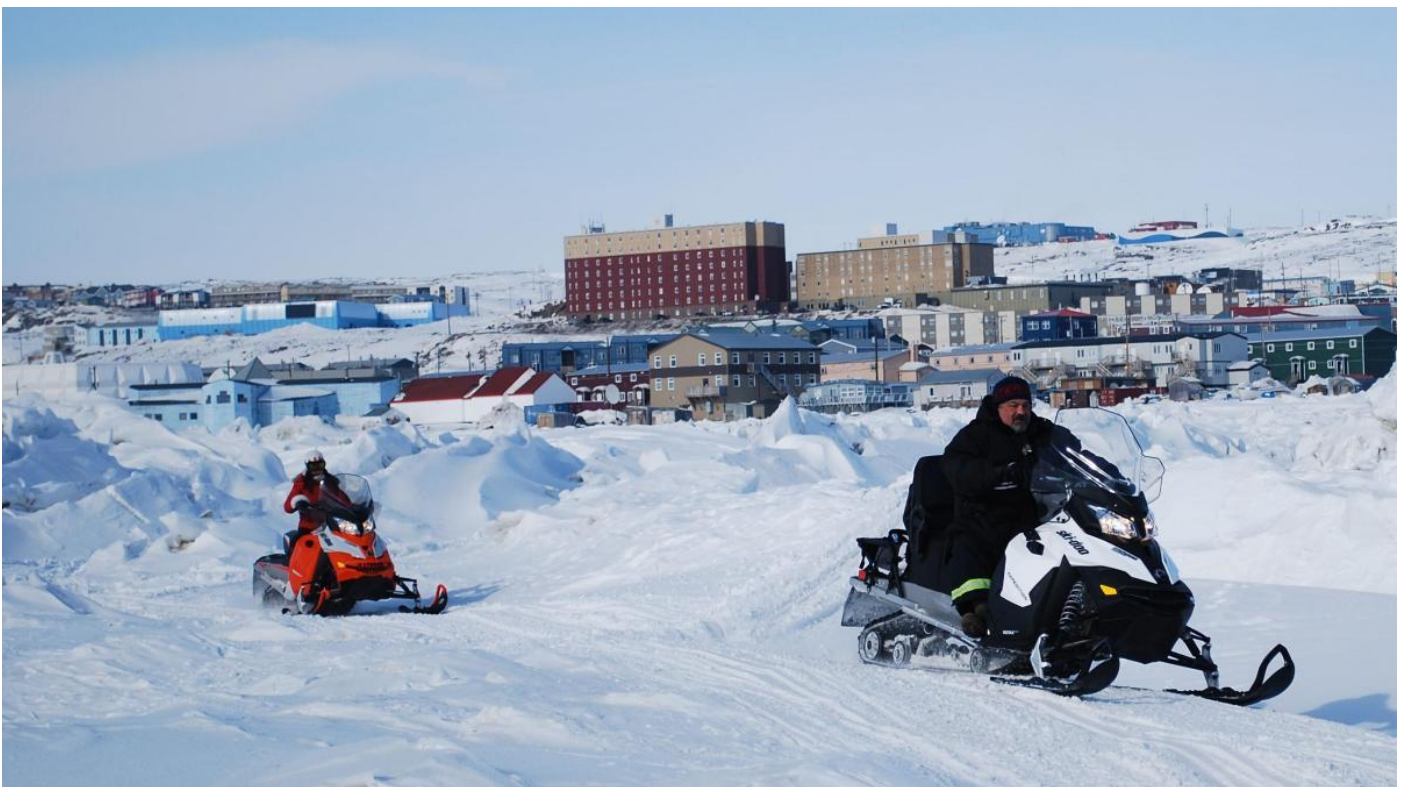
Doc 7. Déplacement en motoneige.