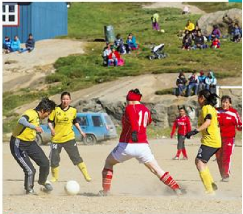
9 Tournoi de football féminin à Tasillaq [2012]

■ « Les jeunes du Groenland tentés par l'émigration au Danemark », d'après AFP, 5 avril 2015.