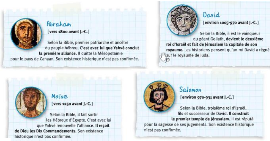
Doc 1 Les quatre principales figures de l'histoire juive selon la Bible hébraïque