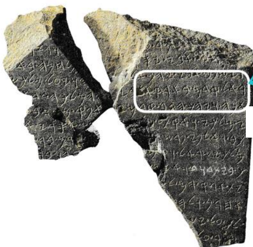
Doc 3 Fragment de la stèle de Tel Dan

1 . Régions bordant la mer Méditerranée, entre la Syrie et l'Égypte actuelles.