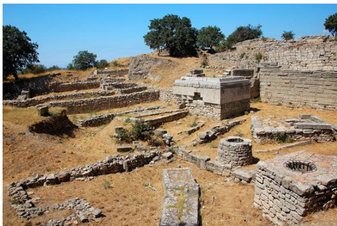
Vestiges de la cité de Troie. By myhsu 1

Vers 1870, un homme d'affaires allemand est à l'origine de l'une des plus fabuleuses découvertes archéologiques de tous les temps.