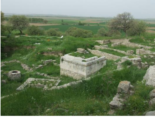
Vestiges de la cité de Troie.

Reste que la présence d'une ville ne prouve pas qu'elle ait été en guerre contre les Grecs.