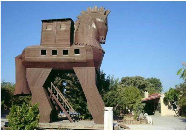
Reconstitution du cheval de Troie.

Il nous reste donc la célèbre légende du cheval de Troie, animal de bois gigantesque à l'intérieur duquel les Grecs s'étaient glissés et grâce auquel ils parvinrent à entrer dans la cité de Troie.