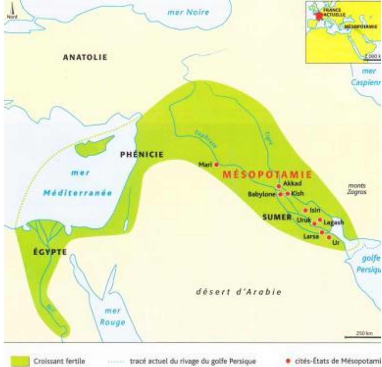
1 Le Croissant fertile au III e millénaire avant J.-C.

I. Pourquoi les premières cité-États apparaissent-elles en Mésopotamie au 4 e millénaire ?