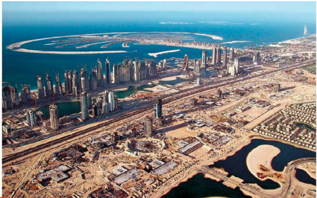
Doc 4 p.291 4 Le front de mer de Dubaï • Le littoral est en évolution permanente ; la plupart des constructions sont liées à des projets touristiques.