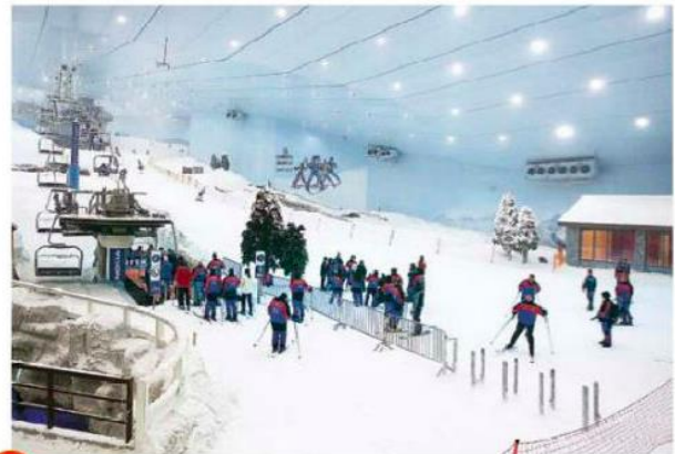
6 Piste de ski intérieure de Dubaï

Les précipitations annuelles sont d'environ 100 mm par an (900 en France) ; la température moyenne annuelle est de 27 degrés.