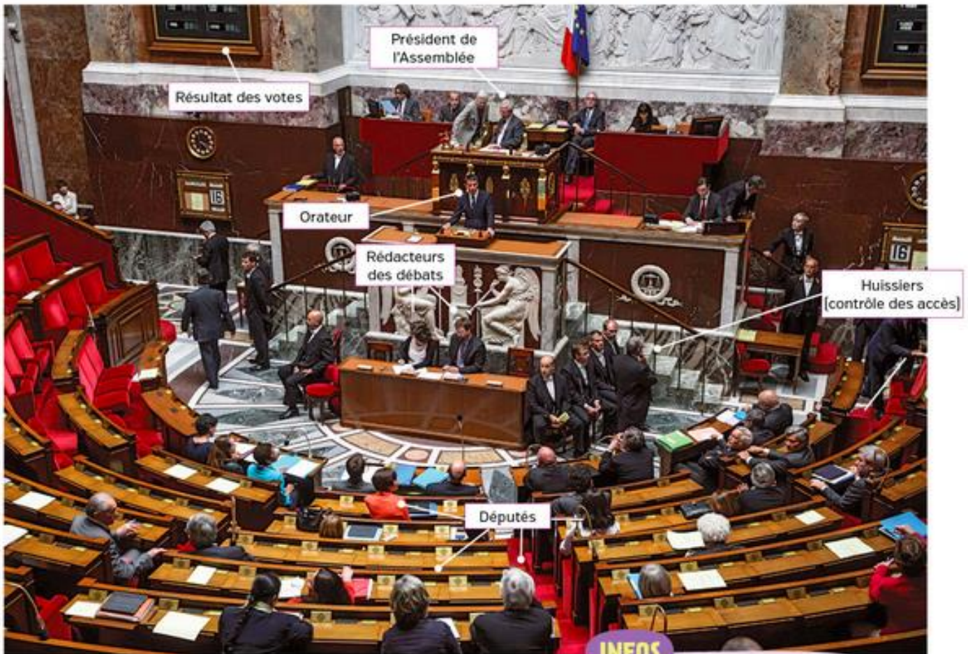
4 Une séance à l'Assemblée nationale (2015)