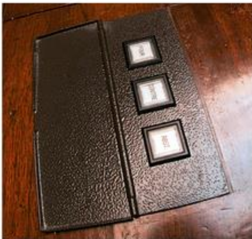
5 Voter à l'Assemblée nationale

En France, l'Assemblée nationale est composée de 577 député(e)s élu(e)s au suffrage universel par les citoyens et les citoyennes. Elle vote la loi et contrôle l'action du gouvernement.