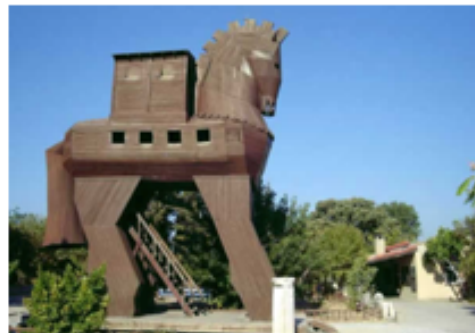
Reconstitution du cheval de Troie.

Il nous reste donc la célèbre légende du cheval de Troie, animal de bois gigantesque à l'intérieur duquel les Grecs s'étaient glissés et grâce auquel ils parvinrent à entrer dans la cité de Troie. Croyant qu'il s'agissait d'un don des dieux, les Troyens le firent entrer dans leurs murs.