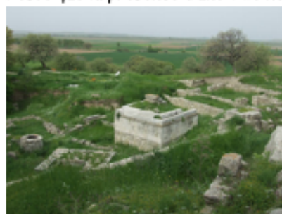
Vestiges de la cité de Troie.

Reste que la présence d'une ville ne prouve pas qu'elle ait été en guerre contre les Grecs.