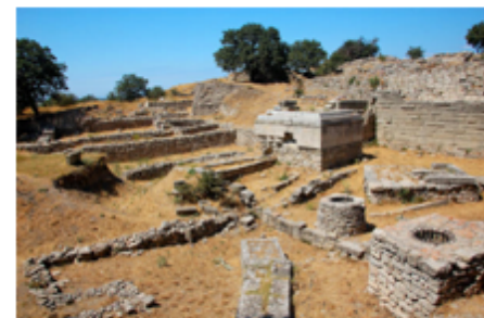
Vestiges de la cité de Troie. By wxybtu 1

Vers 1870, un homme d'affaires allemand est à l'origine de l'une des plus fabuleuses découvertes archéologiques de tous les temps.