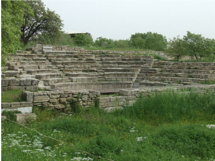
Vestiges de l'amphithéâtre de Troie. 1

Les conteurs auraient progressivement modifié l'histoire, en l'adaptant aux thèmes et aux héros traditionnels qu'ils avaient à leur répertoire.