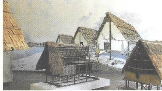
Exposition sur la vie des hommes du néolithique, maison sur pilotis reconstituée (Clairvaux-les-Lacs, Jura).

Pour chaque document sur Jules César (100-44 avant J.-C.), indique le type de source et précise s'il s'agit d'une source directe ou indirecte.