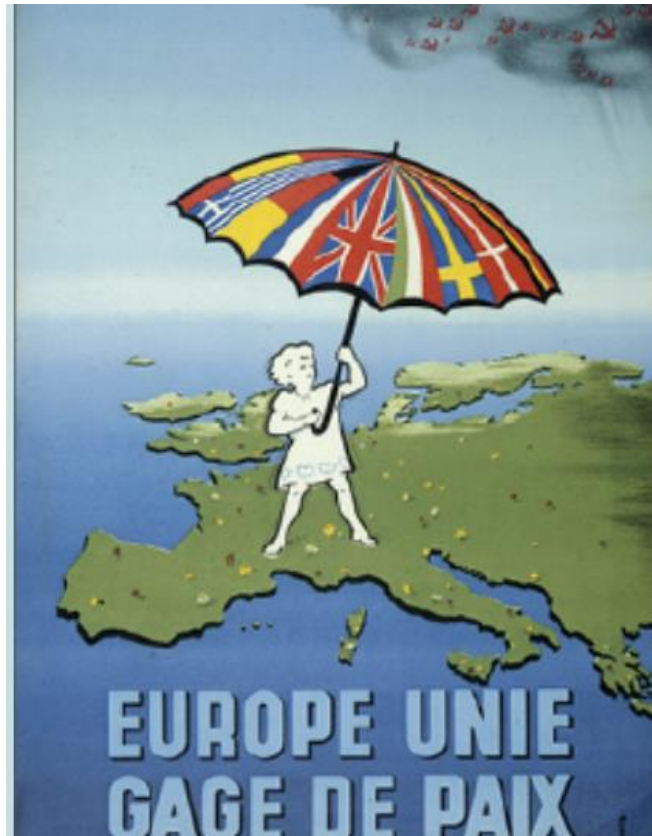
Affiche de 1952 du mouvement anticommuniste Paix et Liberté

1 Communauté européenne du charbon et de l'acier.