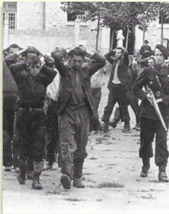
La répression est menée par les nazis mais aussi par la milice créée par le régime de Vichy en 1943.

* Pseudonymes dans la Résistance: Bernard, Bertrand, Séran, Merlin.