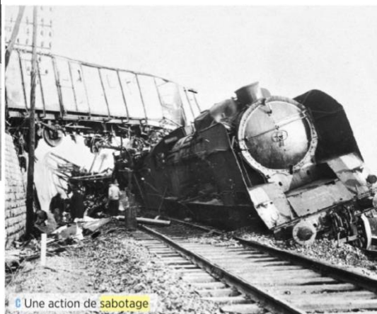
Une action de sabotage