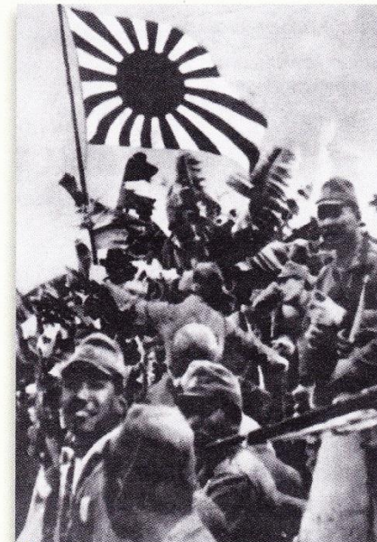
Soldats japonais victorieux aux Philippines, 1 er avril 1942.