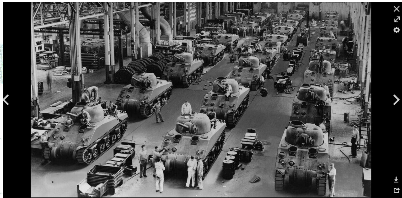
Usine Chrysler de Détroit, fabrication de chars M4 Sherman.