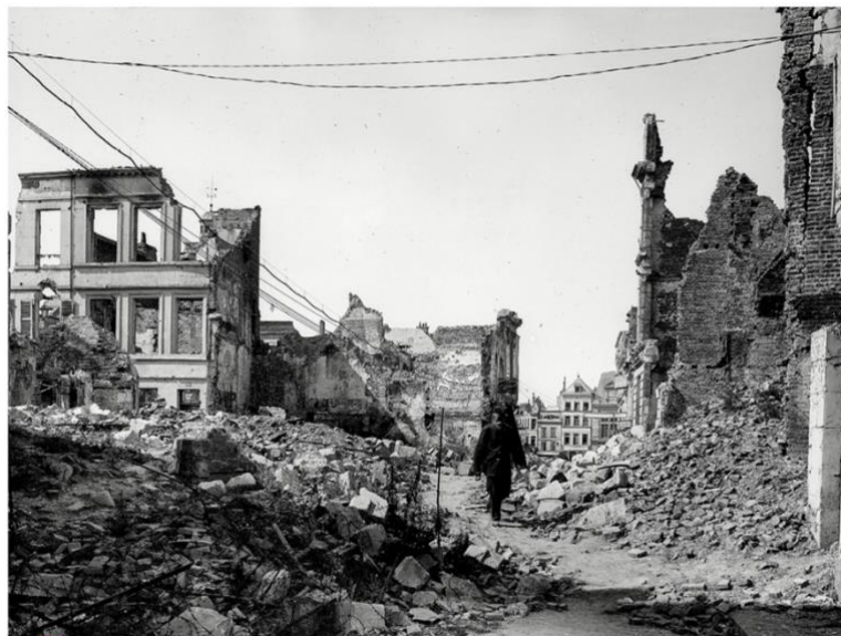
1 La violence de guerre s'exerce contre les populations civiles

Occupée par les Allemands d'août 1914 à octobre 1918, la ville de Saint-Quentin (Aisne) se trouve au cœur des combats, ravagée par les bombardements alliés comme par les destructions allemandes.