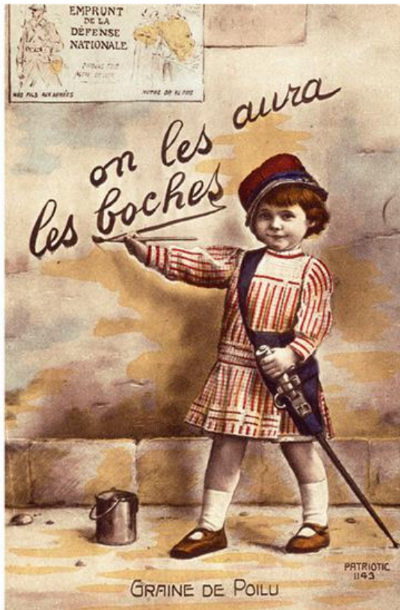
5 Les enfants mobilisés par la propagande Carte postale éditée pendant la Première Guerre mondiale. On remarque, en arrière-plan, une affiche appelant les Français à prêter leur argent. (→ doc 3)