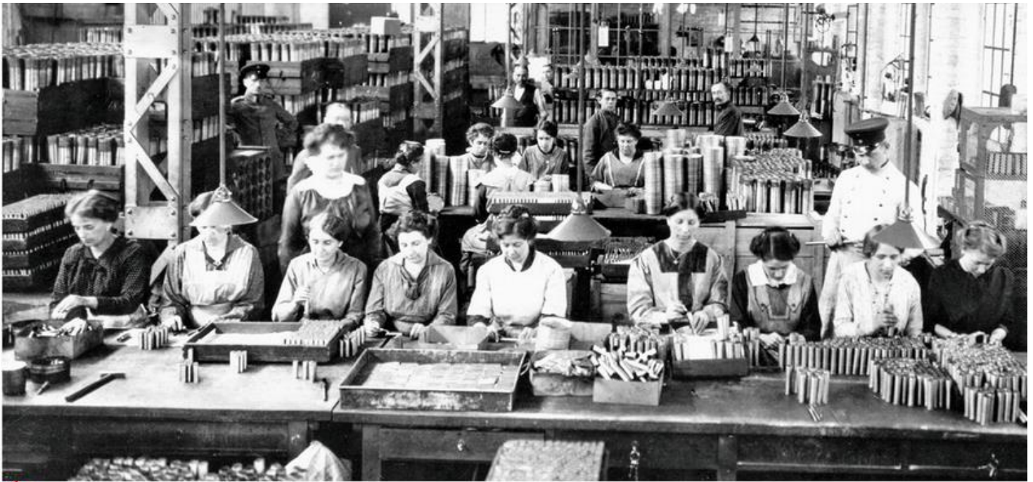
4 La mobilisation de l'arrière Ouvrières allemandes dans une usine de munitions, 1916.