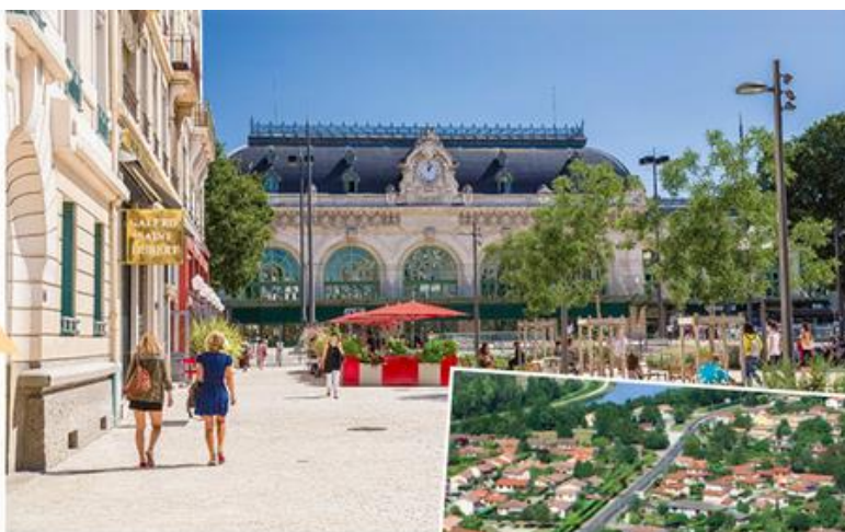
Le centre-ville de Lyon, place Jules-Ferry (2014)

■ Grand Lyon Magazine n° 36, février 2012.