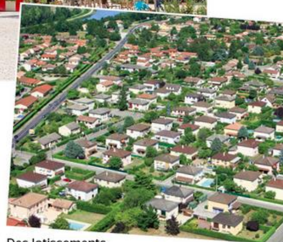
Des lotissements à Meyzieu (2013).