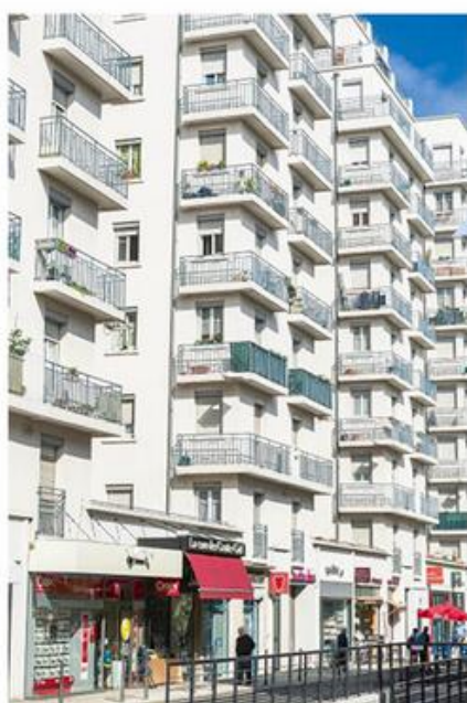
Le quartier Gratte-ciel à Villeurbanne (2015)