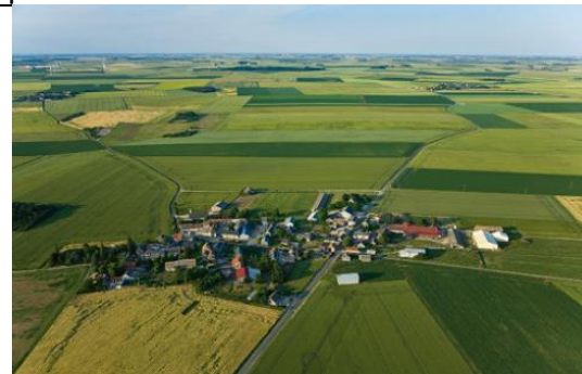
6 . Paysage de la Beauce