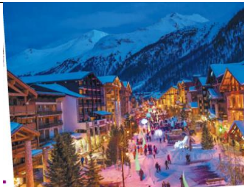
5 . Val d'Isère