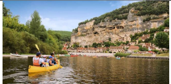
4 . Canoé sur la Dordogne dans le Périgord