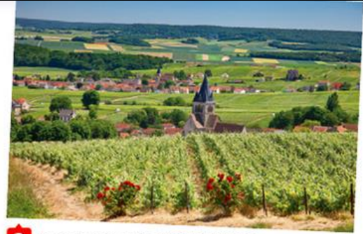
2 Les vignes de champagne à Ville-Dommange (Marne), 2015