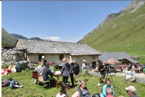
3 . Fête dans le Parc naturel de la Vanoise en Savoie